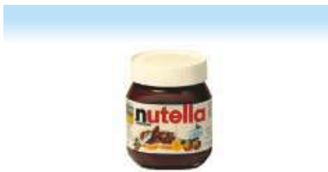
NUTELLA được phép của Ferrero S.p.A.

Việc mở rộng một nhãn hiệu đã có cho các sản phẩm mới giúp cho các sản phẩm mới được hưởng lợi từ hình ảnh và uy tín của nhãn hiệu đó. Tuy nhiên, việc sử dụng một nhãn hiệu mới, cụ thể và thích hợp hơn đối với sản phẩm mới cũng có thể có thuận lợi và giúp cho công ty hướng sản phẩm mới đó đến một nhóm người tiêu dùng cụ thể (ví dụ trẻ em, thiếu niên, v.v...) hoặc tạo ra một hình ảnh cụ thể về sản phẩm mới này. Một số công ty cũng lựa chọn việc sử dụng một nhãn hiệu mới kết hợp với một nhãn hiệu đã có từ trước (ví dụ như Ferrero và Nutella).