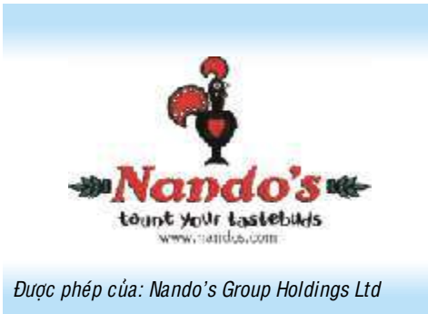
Được phép của: Nando's Group Holdings Ltd

phẩm này với số lượng lớn và theo một cách thức thống nhất. Hệ thống bao gồm nhiều yếu tố khác nhau góp phần tạo nên sự thành công của các cửa hàng NANDO'S, bao gồm cả công thức chế biến và phương pháp chuẩn bị suất ăn tạo nên một sản phẩm là tổng hợp của chất lượng, kiểu đồng phục của nhân viên, thiết kế kiến trúc ngôi nhà, thiết kế bao gói và các hệ thống quản lý và kế toán. NANDO'S phổ biến kiến thức và kinh nghiệm của mình cho những người tiếp nhận và giữ quyền kiểm tra và kiểm soát những người được cấp phép. Như một phần đáng kể của hợp đồng chuyển giao đặc quyền kinh doanh, những người được cấp phép cũng sẽ được phép và giúp đỡ sử dụng nhãn hiệu NANDO'S.